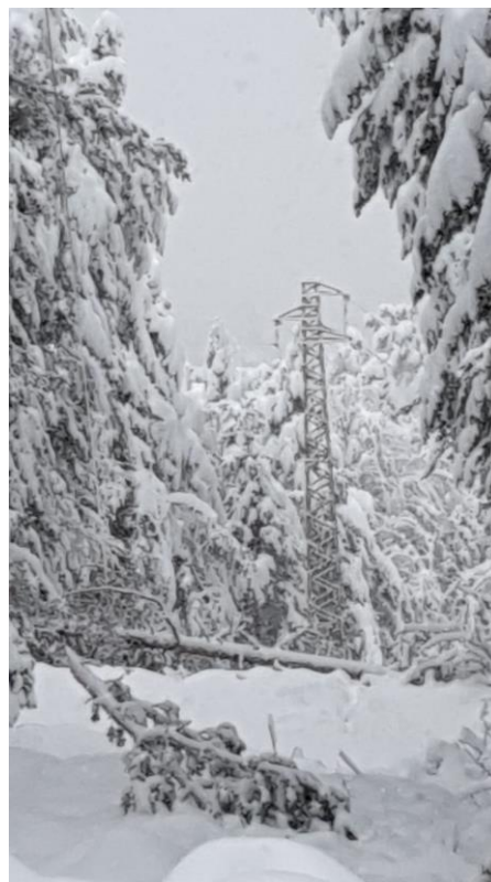
Figura 10: novembre 2019 linee MT Oltretorrente e San Lugano