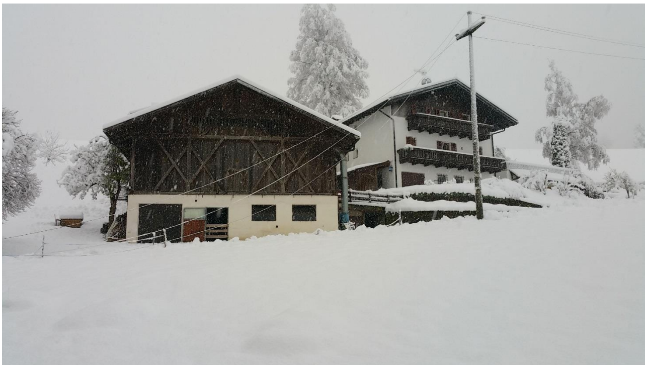
Figura 7: novembre 2019 linea MT Castelrotto

L’Alto Adige è inoltre soggetto a periodi di condizioni perturbate dovute a manicotti di ghiaccio e contemporanea caduta di piante. Di seguito riportiamo alcune immagini delle zone colpite dalle nevicate di novembre 2019