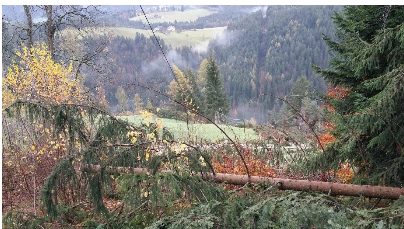
Figura 1 28 ottobre – val d’EGA