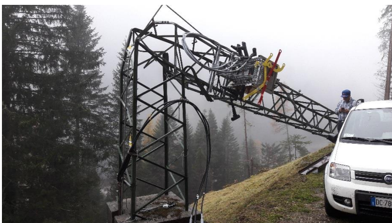
Figura 4: 28 ottobre – Val d’Ultimo linea Pracomune

28 ottobre – Val d’Ultimo linea Pracomune