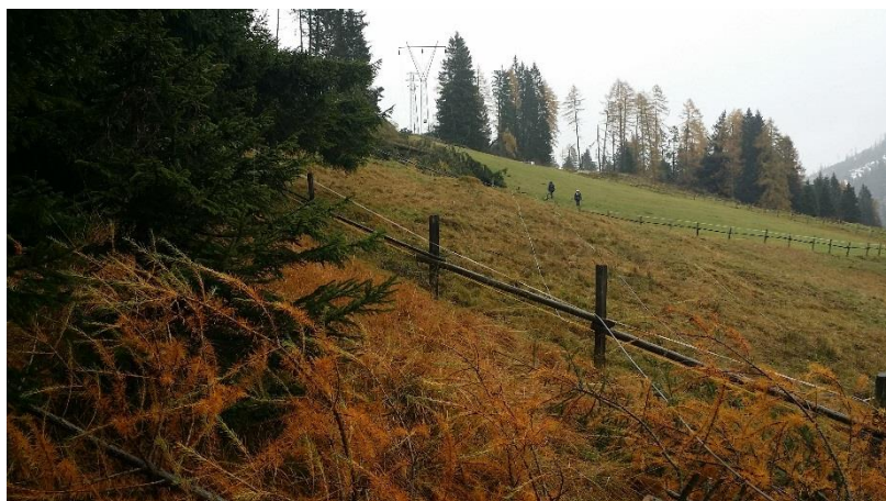
Figura 3: 28 ottobre – Linea Pampeago

28 ottobre – Val d’Ultimo linea Pracomune