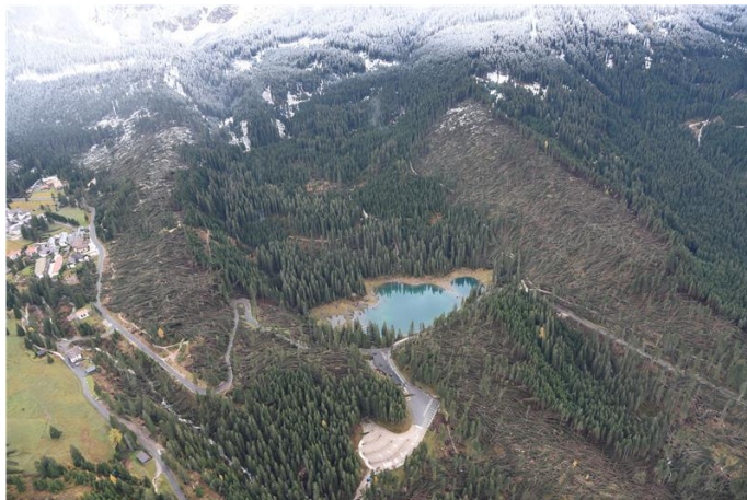
Figura 6:28 ottobre – Linea Val d’EGA

L’Alto Adige è inoltre soggetto a periodi di condizioni perturbate dovute a manicotti di ghiaccio e contemporanea caduta di piante. Di seguito riportiamo alcune immagini delle zone colpite dalle nevicate di novembre 2019