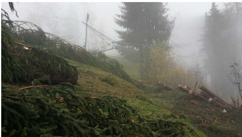
Figura 2: 28 ottobre – Linea Pampeago