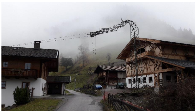
Figura 5: 28 ottobre – Val d’Ultimo linea Pracomune