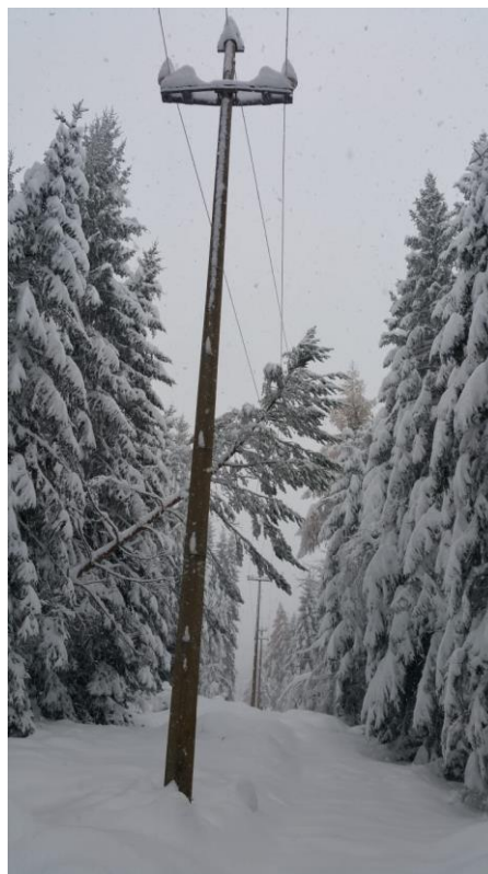
Figura 10: novembre 2019 linee MT Campologo e Costacolle