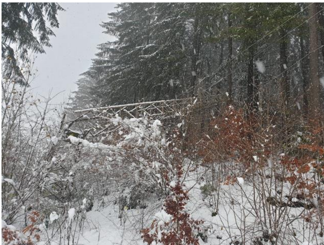
Figura 8: novembre 2019 linea MT Chienes