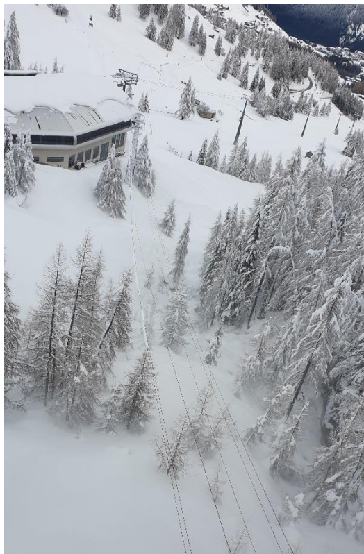
Figura 9: novembre 2019 linea MT Selva